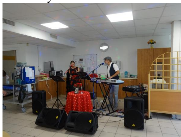
Spectacle du duo « Temps d'Accords » le 22